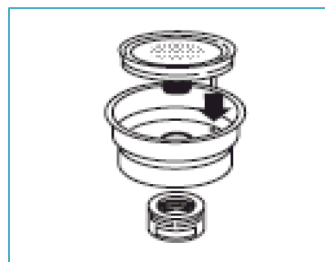
Nettoyez les filtres.

* les images sont des exemples - il est possible que votre appareil soit un peu différent.